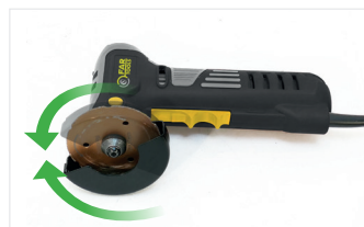
Carter indexable sans outils Carter to be swivelled without tool