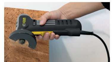
Capacité de coupe Max. = 15 mm Max. cutting capacity = 15 mm